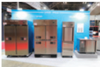
▲当社独自の「トビラ」ラインナップ