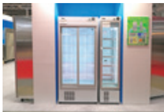
▲ノンフロンショーケース