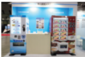
▲自動販売機ラインナップ

その他にもノンフロン冷媒 R600a を使用した「ノンフロンショーケース」を参考出展。SDGs の環境保護の目標に向けて、ノンフロンへの転換に取り組んでいます。