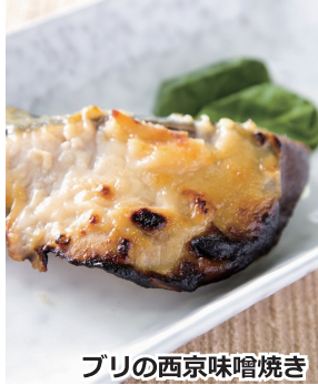
ブリの西京味噌焼き