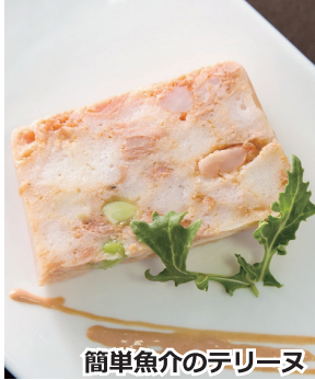
簡単魚介のテリリーヌ